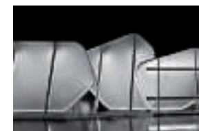
STUDIO AMEY & LE SONN

amey.lesonn@gmail.com www.studioameylesonn.com